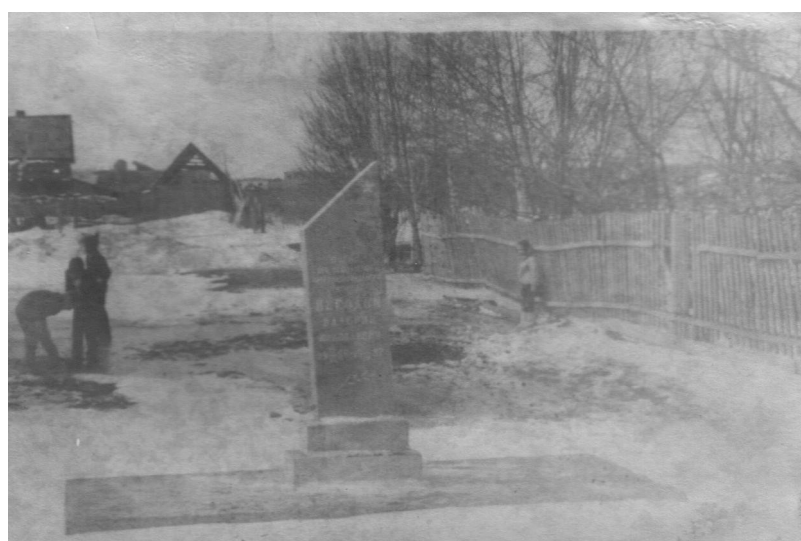
Первоначальное место. Май 1988 года.