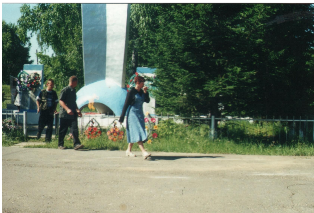
Одноклассники «в гостях».