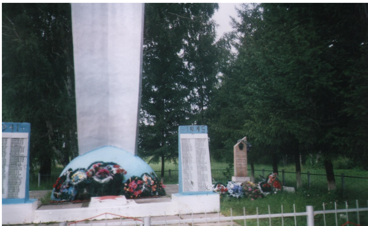
« Два брата »