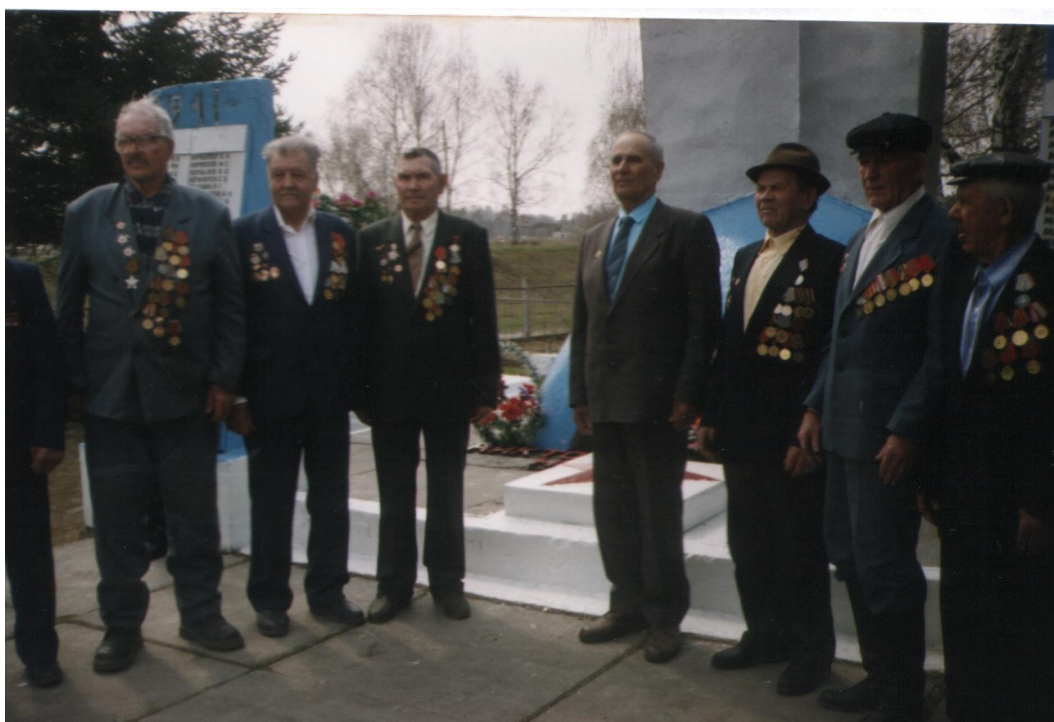
« Не стареют душой ветераны...»