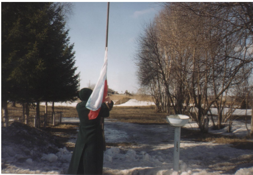
Соревнования по волейболу, посвящённые воинам – землякам.