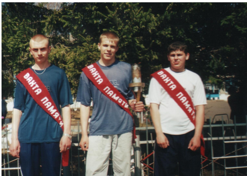
Май 2004 года.