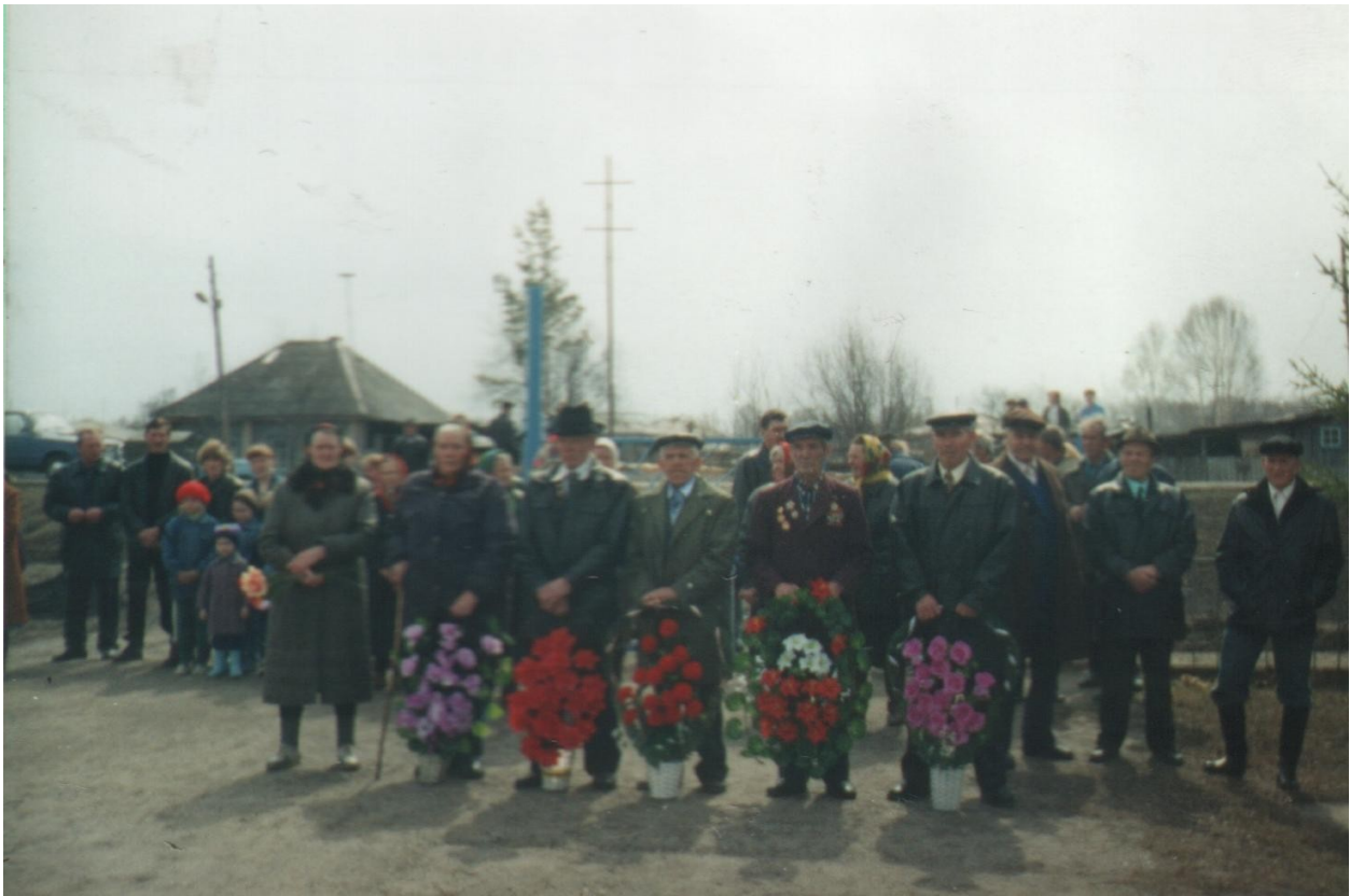
Ветераны войны с семьями на митинге 9 мая 1998 года.