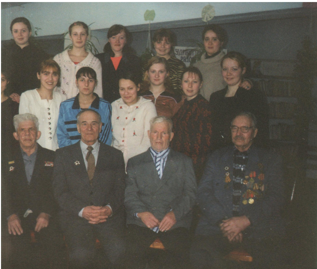
Встреча с ветеранами учащихся 11 класса