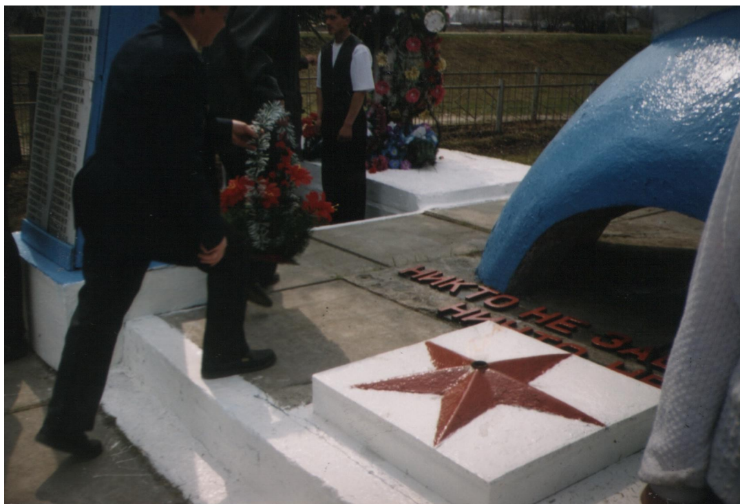
Май 2001 год.