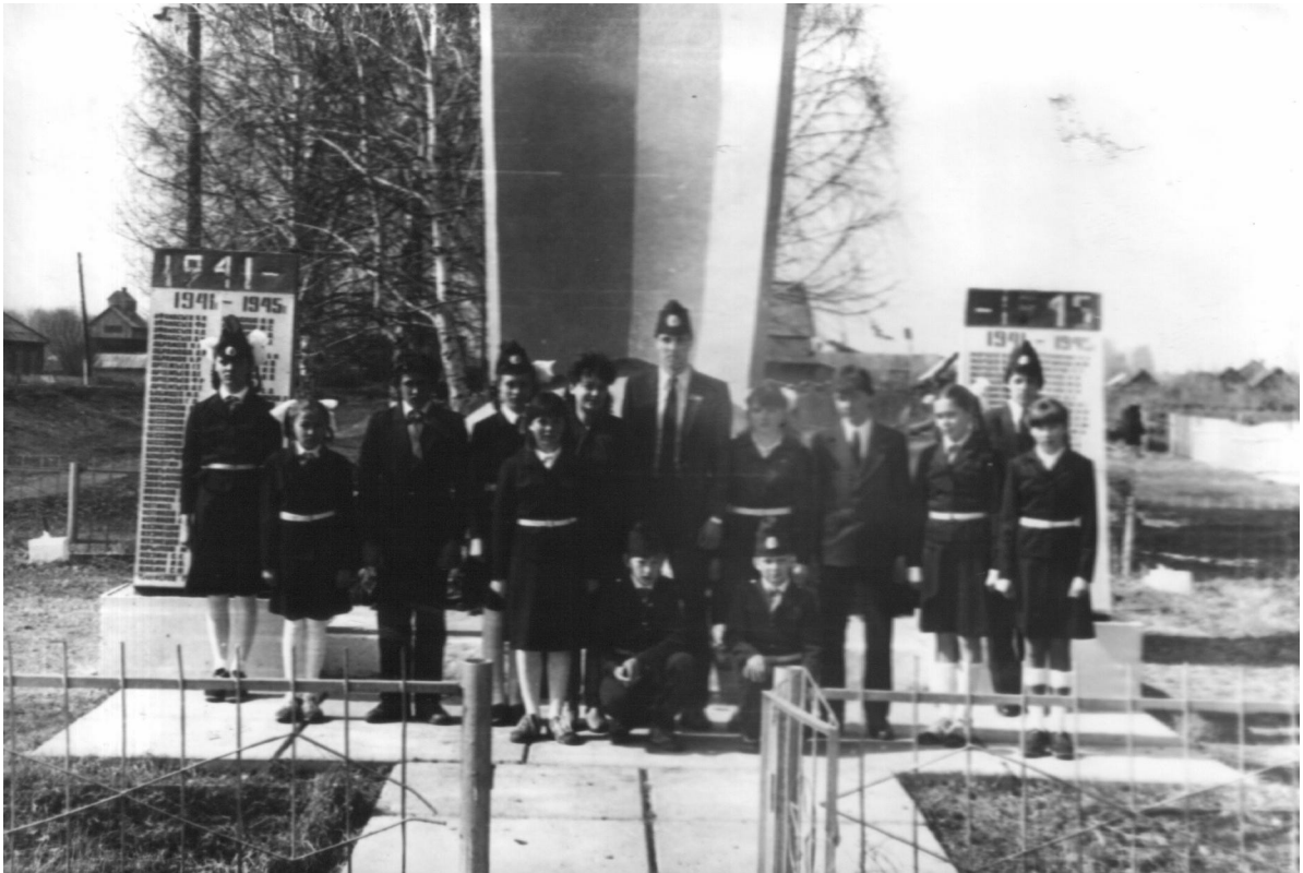
Первый состав Пост № 1 Май 1986 год.